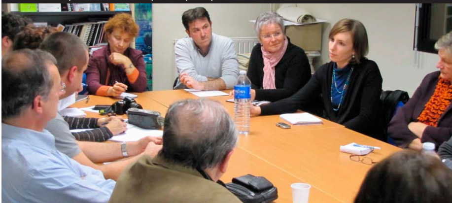
Une dizaine de prestataires touristiques ont participé au 1 er Atelier.

Pour être dans le programme, les organisateurs d'activités et de manifestations sont donc invités à donner leurs informations à leur Office de Tourisme cantonal au mois de mars. Quant aux sets de table, ils seront de nouveau disponibles pour tous les restaurateurs, mais aussi les hôteliers, les propriétaires de chambres d'hôtes et les viticulteurs qui accueillent dans leur propriété. Une nouvelle carte "Destination Vignobles" sera également distribuée à la même période.