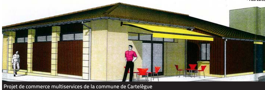
Projet de commerce multiservices de la commune de Cartelègue

Le Contrat de Pays, c'est aussi le moyen de soutenir des projets de dimension intercommunale qui contribuent à l'échelle du Pays à apporter des réponses aux besoins de la population en matière d'emplois et de services : l'extension du CFM de la Haute Gironde à Reignac, la Plaine des Sports du Bouilh à St-André, la construction d'un nouveau cinéma à Blaye, la création d'un hôtel d'entreprises sur le canton de St-Savin, la construction d'un Accueil de Loisirs Sans Hébergement sur le canton de Bourg, etc.