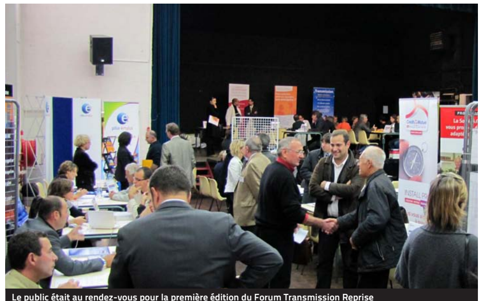
Le public était au rendez-vous pour la première édition du Forum Transmission Reprise