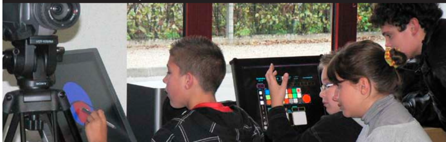
En action : l'atelier Outils Numériques

Ce parcours de découverte des métiers de l'image qui a débuté en février par une formation des animateurs, a permis aux enfants fréquentant les centres de loisirs et Points Jeunes de rencontrer des professionnels qui les ont accompagnés dans la création d'un film. Ils sont ensuite allés au cinéma (à Blaye, St-Ciers/G et St-André de Cubzac) où ont été projetés leurs films qu'ils ont pu commenter aux autres enfants. Enfin, ils ont participé à une dizaine d'ateliers «Actor's Studio» à St-Ciers/G., Bourg et St-Savin. Les adultes ont pu participer lors du festival à des soirées conférences/débats et au vidéoconcert qui a conclu le parcours à Bourg. Au regard de la réussite de cette première édition, le souhait est de reconduire ce projet en 2011.