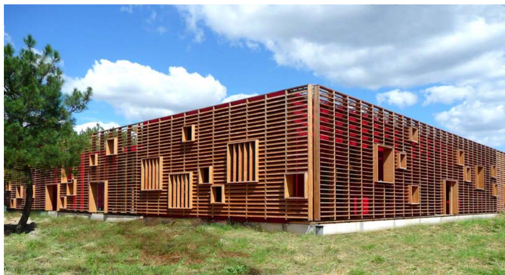
L'extension du Centre de Formation Multimétiers de Reignac, inscrite au Contrat de Pays, sera inaugurée le samedi 22 janvier