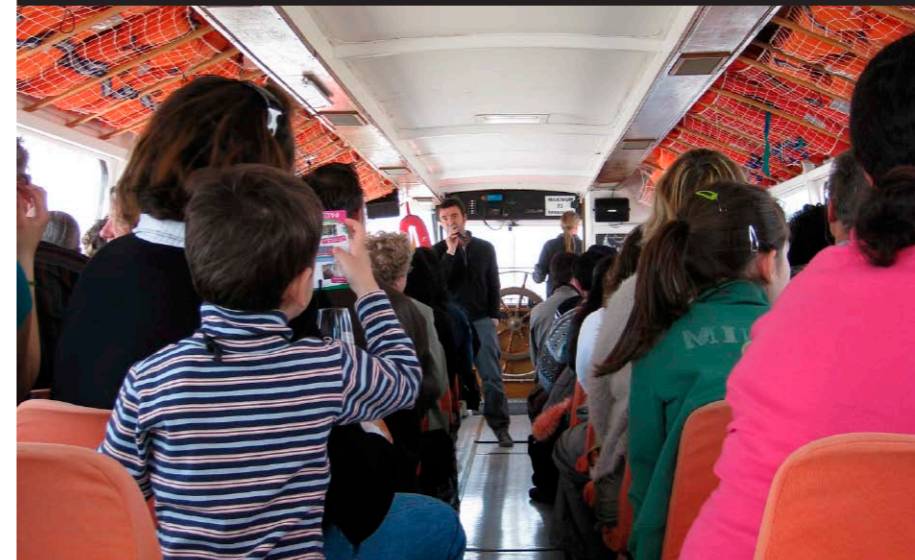
Les balades en bateau sur l'Estuaire: une offre et une fréquentation qui se développent.