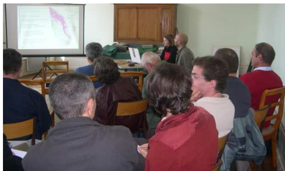
Atelier Agriculture et Environnement