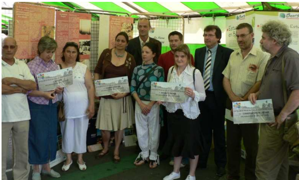
Remise des prix lors de la Fête de l'Asperge