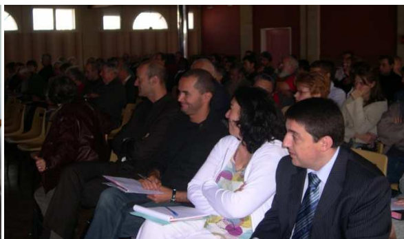
Près de 80 participants au total